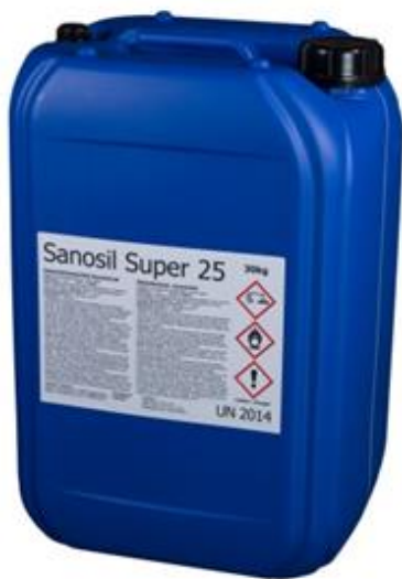
Sanosil Super 25